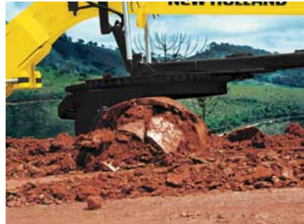
LÁMINA CENTRAL CON PERFIL EVOLVENTE ROLL AWAY

La motoniveladora RG170.B ofrece una serie de opciones para facilitar los trabajos y aumentar la productividad: fluctuación de las láminas frontal y central, gancho trasero, esquinas de lámina reforzados, extensión de lámina, placa de empuje delantera, soporte para rueda de auxilio, además de otros ítems ya conocidos y consagrados en el mercado.