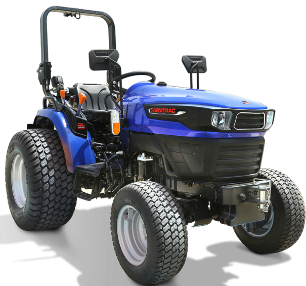
FT 30 4WD GARDEN