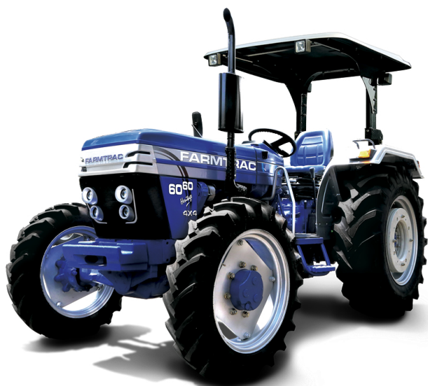
FT 6060 4WD