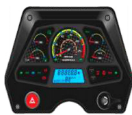
VISTA NOCTURNA Alta claridad para visión nocturna