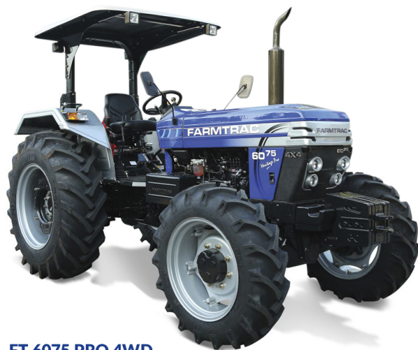
FT 6075 PRO 4WD