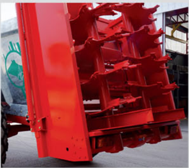
DOS ROLOS ESPARCIDORES VERTICALES