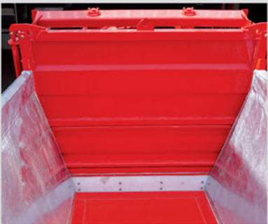
PUERTA CON GUILLOTINA