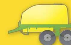
Balancín: 1000 x R16 Trocha: 1,4 - 2,10 mts